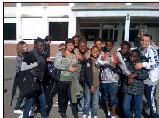
Les élèves du « Café Philo » du collège Albert Samain de Roubaix (Nord)

– les jeunes abandonnés des quartiers « alternatifs » peuplés de déclassés dont la marginalisation résulte d'une société marquée par l'éclatement des familles et des communautés.