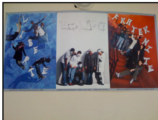
Travail d'élèves, collège Romain Rolland de Clichy-sous-Bois (Seine Saint-Denis)

Leurs compétences et leurs engagements nous ont été précieux. Les visites ont été complétées par des tables rondes thématiques, des auditions, un atelier de prospective, des séquences vidéo et un film de présentation de l'étude qui sont référencés sur un blog internet ( http://blogs.senat.fr/annees-college/ ).